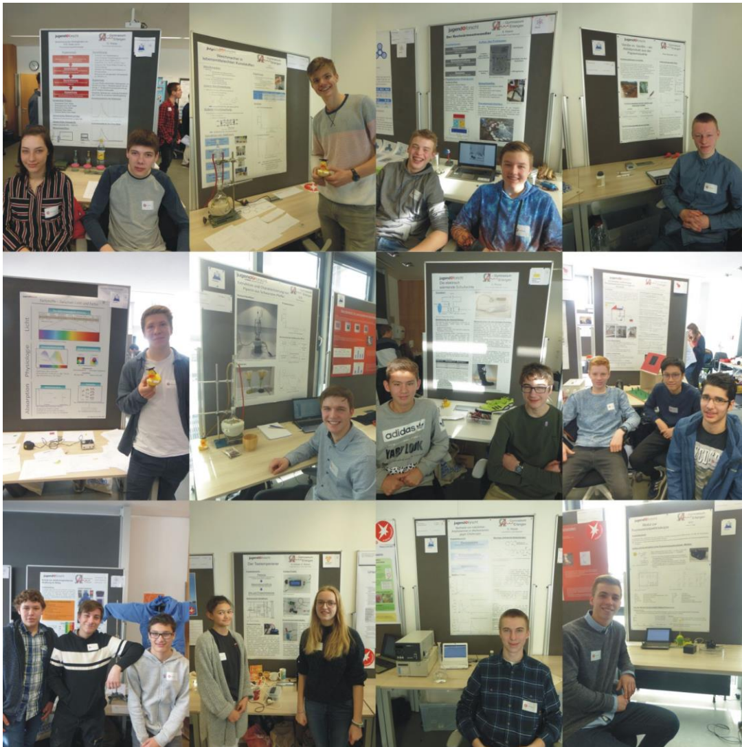
Jugend forscht Wettbewerb 2019