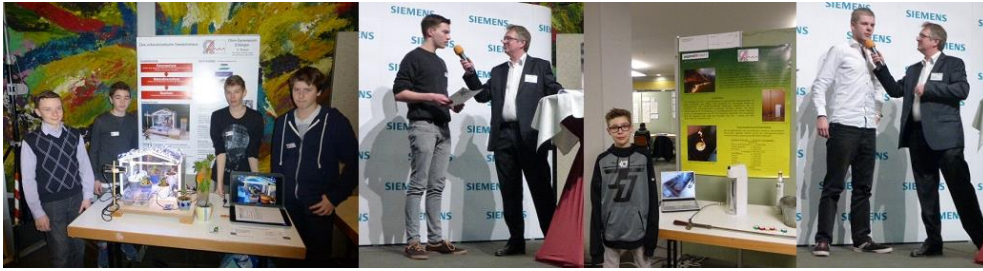
Jugend forscht Wettbewerb 2015