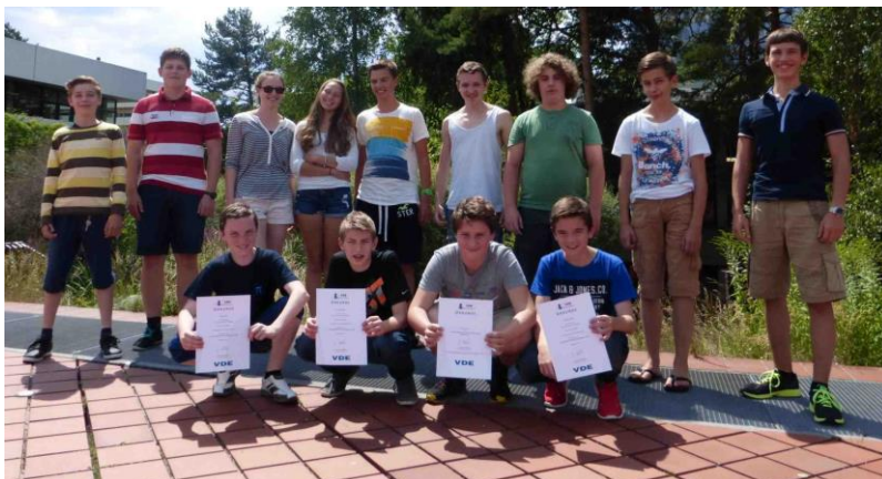
VDE Wettbewerb 2014