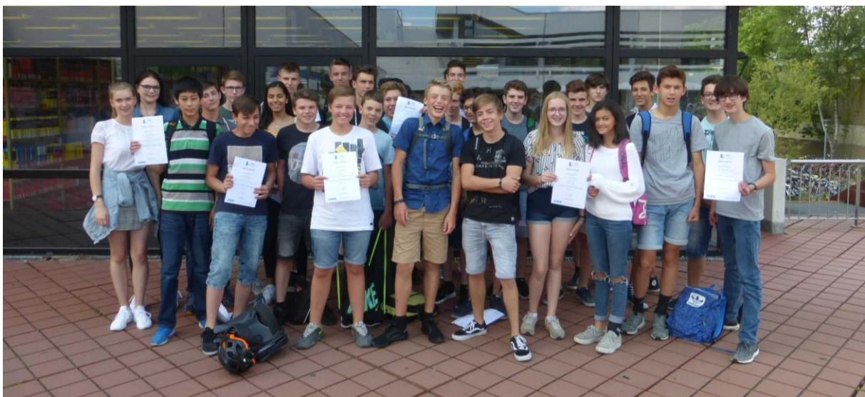
VDE Wettbewerb 2018