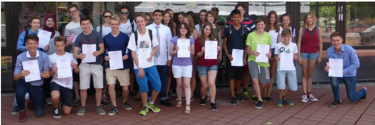
VDE Wettbewerb 2015