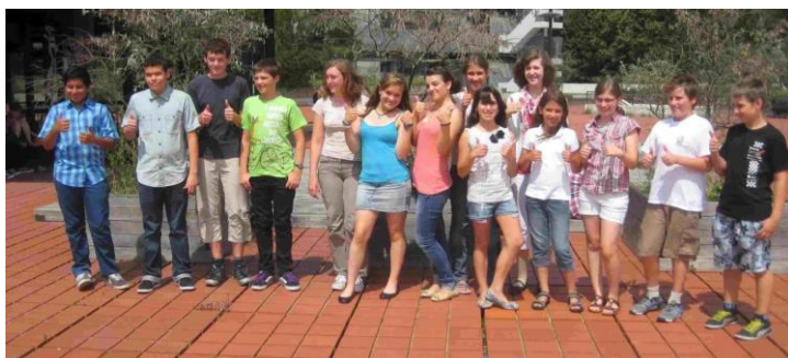
VDE Schülerforum 2012