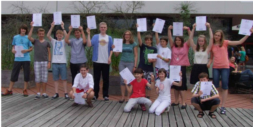
VDE Wettbewerb 2013