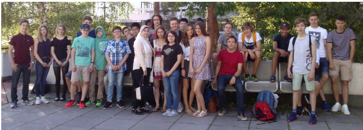
VDE Wettbewerb 2016