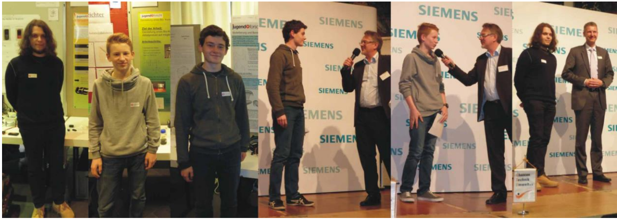
Jugend forscht Wettbewerb 2014