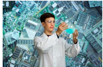
Bundeswettbewerb Jugend forscht 2016