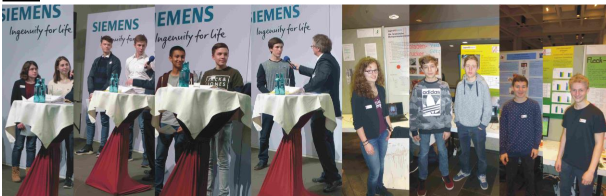
Jugend forscht Wettbewerb 2016