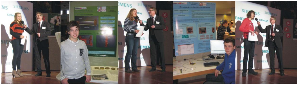
Jugend forscht Wettbewerb 2013