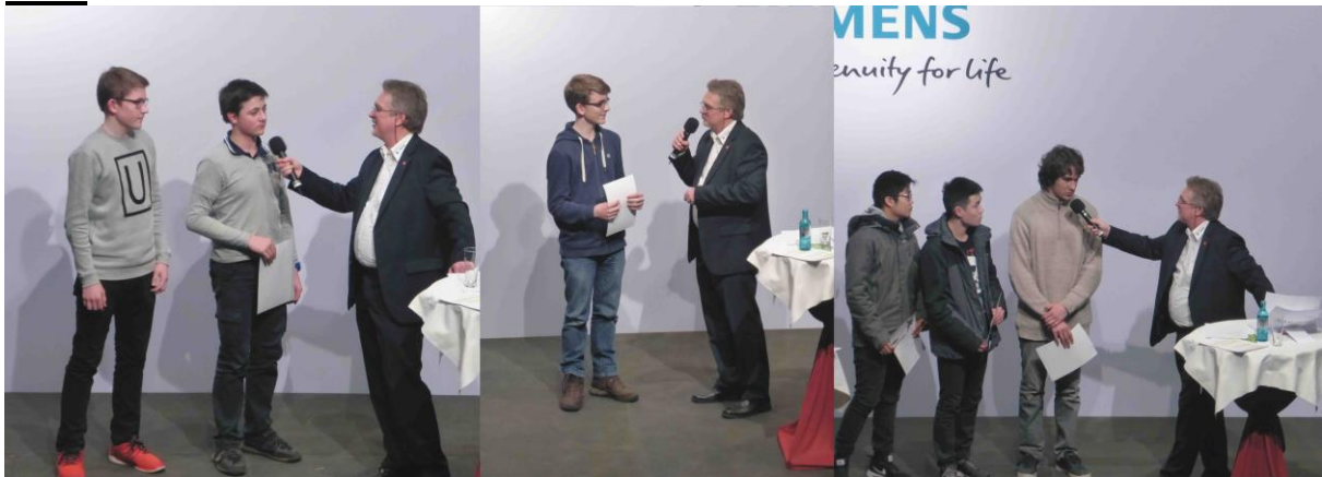
Jugend forscht Wettbewerb 2017